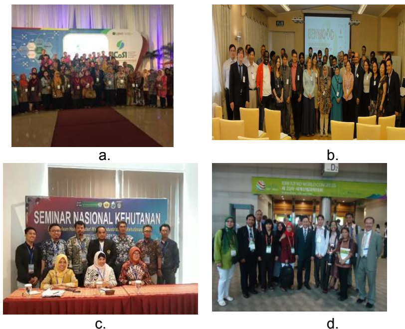
Gambar 2. Seminar Nasional dan Internatinal: a. di Yogyakarta, b. Itali, c. Mataram, d. Korea Selatan

Seperti halnya dengan pelatihan yang dilakukan di luar negeri, kegiatan seminar yang diikuti juga dapat menambah wawasan dan jaringan kita dengan berbagai lembaga dan dosen-dosen yang berasal dari berbagai negara. Salah satu kegiatan dalam penelitian yang sangat penting adalah publikasi. Dengan publikasi, maka dapat membantu peningkatan pemeringkatan PT sekaligus berguna untuk pribadi dosen itu sendiri [7-9]. Banyak dosen yang memperoleh hibah penelitian, namun tidak semuanya dapat memenuhi luaran penelitian berupa publikasi di Jurnal International bereputasi. Oleh sebab itu, perlu adanya program peningkatan kualitas penulisan jurnal bereputasi seperti yang ditawarkan oleh DIKTI melalui program World Class Professor (WCP), dengan salah satu kegiatannya adalah publikasi bersama, dimana dosen