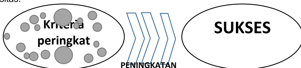
Gambar 1. Instrumen peningkatan peringkat universitas

suatu institusi kurang dari ukuran keberhasilan akademik, disarankan untuk meninjau kebijakannya sendiri dan fokus pada peningkatan volume dan kualitas publikasi elektronik. Peringkat pengembang Webometrics memperhitungkan jumlah halaman situs web universitas yang diindeks oleh mesin pencari, tautan eksternal ( external links ) ke sana, kutipan sumber daya ( resource citations ), dan jumlah file yang diunggah ke situs web; dengan kata lain, memberi value pada konten dan konstituen informasi dari situs web universitas.