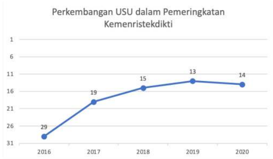
Gambar 1. Perkembangan USU dalam Pemeringkatan Perguruan Tinggi Nonvokasi

Pada pemeringkatan Webometrics pada bulan Juli 2020, USU berada pada urutan 8 di Indonesia yang berarti naik 2 peringkat jika dibandingkan dengan bulan yang sama pada tahun 2019 di mana USU masih berada pada peringkat ke-10.